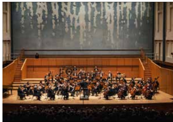
@ Γιώργος Χρυσοχοϊδης